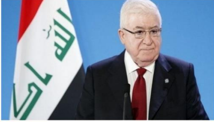
Irak Cumhurbaşkanı Fuad Masum

“İngiltere’nin Türkiye’nin demokratik olarak seçilmiş kurumlarını desteklediğini vurgulayan İngiltere Başbakanı May, “Türk ordusunun bazı üyelerinin teşebbüs ettiği darbeyi kuvvetle kınıyoruz. Daha fazla şiddetten kaçınmak için her şey yapılmalı” dedi.