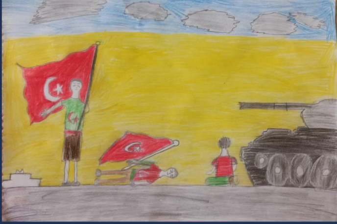
AHMET YARICI 4/B