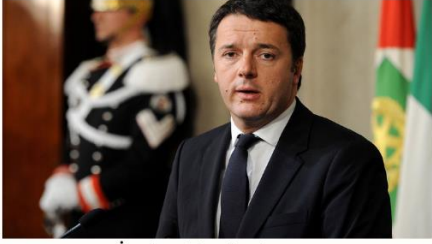
İtalya Başbakanı Matteo Renzi

FETÖ'nün darbe girişiminin püskürtülmesiyle Türkiye'de istikrar ve demokratik kurumların üstünlüğünün tesis edilmeye başlandığını belirten Renzi, Türkiye'de gece boyunca yaşanan gelişmeleri yakından izlediğini, darbe girişiminin bertaraf edilmesinden dolayı rahatladığını söyledi.