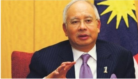
Malezya Başbakanı Necip Rezak

Tüm Kanadalılar adına, Türkiye'de yaşanan olaylarla ilgili kaygılarımızı ifade etmek istiyorum. Tüm taraflara itidal çağrısında bulunuyoruz. Kanada, Türk demokrasisinin muhafazasını destekler."