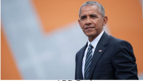
ABD Başkanı Barack Obama

“Devletlere karşı anayasal olmayan, şiddet içeren yöntemlere başvurulmasını kategorik olarak reddediyoruz. Can kayıpları için taziyelerimizi sunuyor, Türkiye’de anayasal düzenin ve istikrarın en kısa sürede yeniden tesis edilmesini diliyoruz.”