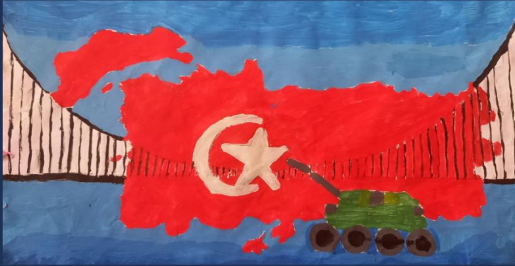
HAVİN ERGÜL 3/A