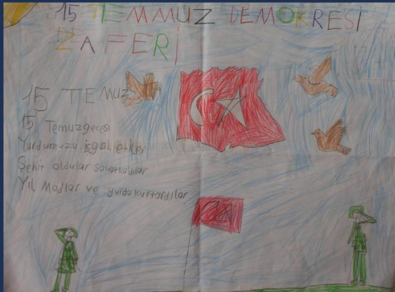
NEHİR YARICI 3/A