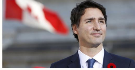
Kanada Başbakanı Justin Trudeau

FETÖ'nün darbe girişiminin püskürtülmesiyle Türkiye'de istikrar ve demokratik kurumların üstünlüğünün tesis edilmeye başlandığını belirten Renzi, Türkiye'de gece boyunca yaşanan gelişmeleri yakından izlediğini, darbe girişiminin bertaraf edilmesinden dolayı rahatladığını söyledi.