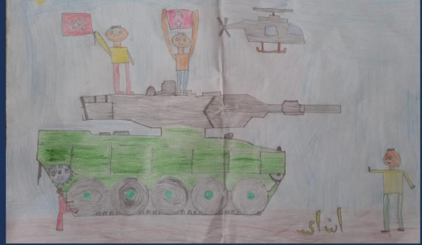
DEVİRAN YAŞLAK 3/A