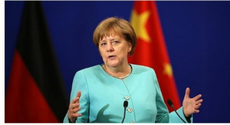
Almanya Başbakanı Angela Merkel

ABD Başkanı ve Dışişleri Bakanı, Türkiye’deki bütün tarafların demokratik yollarla seçilmiş hükümeti desteklemesi, sükunet göstermesi ve her türlü şiddet veya kan dökülmesinden uzak durması konusunda mutabık kaldı. Bakan Kerry bakanlığın, Türkiye’deki Amerikan vatandaşlarının güvenliğine odaklanmayı sürdüreceğini vurguladı.