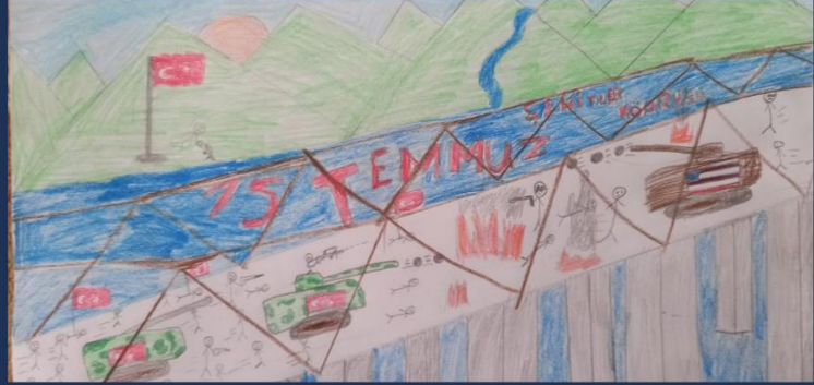
METE TİMUÇİN ÖNGAN 4/A