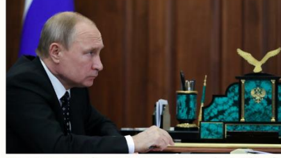
Rusya Federasyonu Devlet Başkanı

“Silahlı kalkışmayı sert şekilde kınıyorum, bunu Türk milletinin ulusal çıkarlarına, ülkenin demokratik yapısına ve hukukun egemenliğine darbe olarak değerlendiriyorum