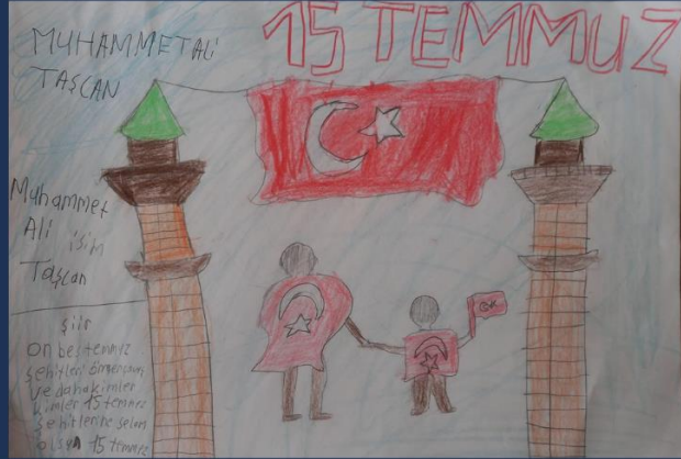
MUHAMMET ALİ TAŞCAN 4/A