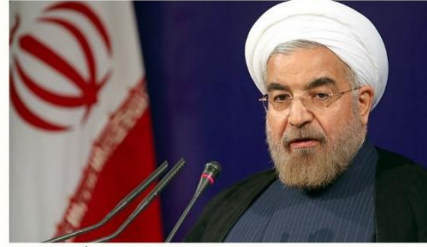
İran Cumhurbaşkanı Hasan Ruhani

Irak’ın, komşu ülke Türkiye’nin bu krizi aşması için ümitleri çok yüksektir. Türkiye’nin içerisinde olduğu olağanüstü durumu atlatabileceğine inanıyorum.