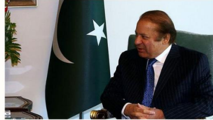
Pakistan Başbakanı Navaz Şerif

Sandıkta ortaya konulan halkın iradesini baltalamaya yönelik yasa dışı girişimlerin karşısında birlikte duruyoruz. Şekli ne olursa olsun, darbelerle müsamaha gösterilmemelidir. Demokratik süreç, özgürlüğümüz, güvenliğimiz ve refahımızın temelidir."