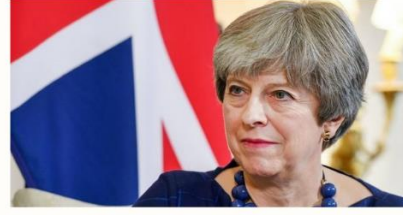
İngiltere Başbakanı Theresa May

“Darbe girişimi, nereden bakılırsa bakılsın kabul edilemeyecek bir şey. TBMM gibi ülkenin demokratik kurum ve kuruluşlarına saldırılar ve bombardımanlar gerçekleştirildi. Bu darbe girişimi en ağır şekilde kınanmalı. (15 Temmuz gecesi) Gece yarısından önce darbe girişiminin kabul edilemez olduğunu açıkça bildirdim.”