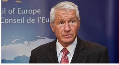
Avrupa Konseyi Genel Sekreteri Thorbjorn Jagland

“Darbe girişimi, nereden bakılırsa bakılsın kabul edilemeyecek bir şey. TBMM gibi ülkenin demokratik kurum ve kuruluşlarına saldırılar ve bombardımanlar gerçekleştirildi. Bu darbe girişimi en ağır şekilde kınanmalı. (15 Temmuz gecesi) Gece yarısından önce darbe girişiminin kabul edilemez olduğunu açıkça bildirdim.”