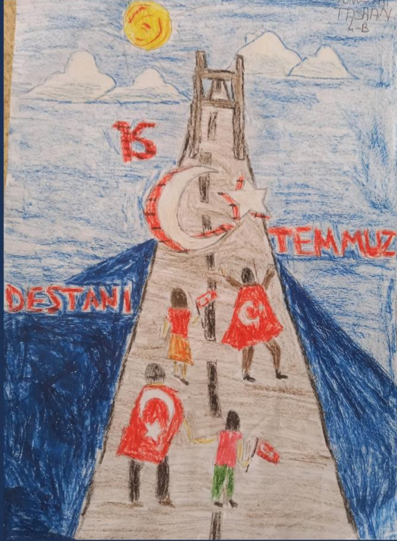
YUNUS ALİ TASHAN 4/B