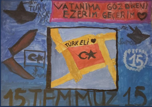
AZRANUR KARAÜZÜM 4/A